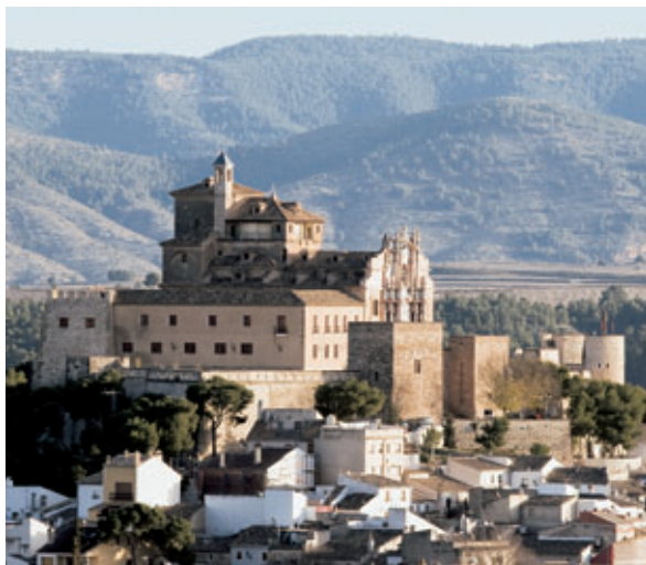
Castillo de Caravaca de la Cruz.